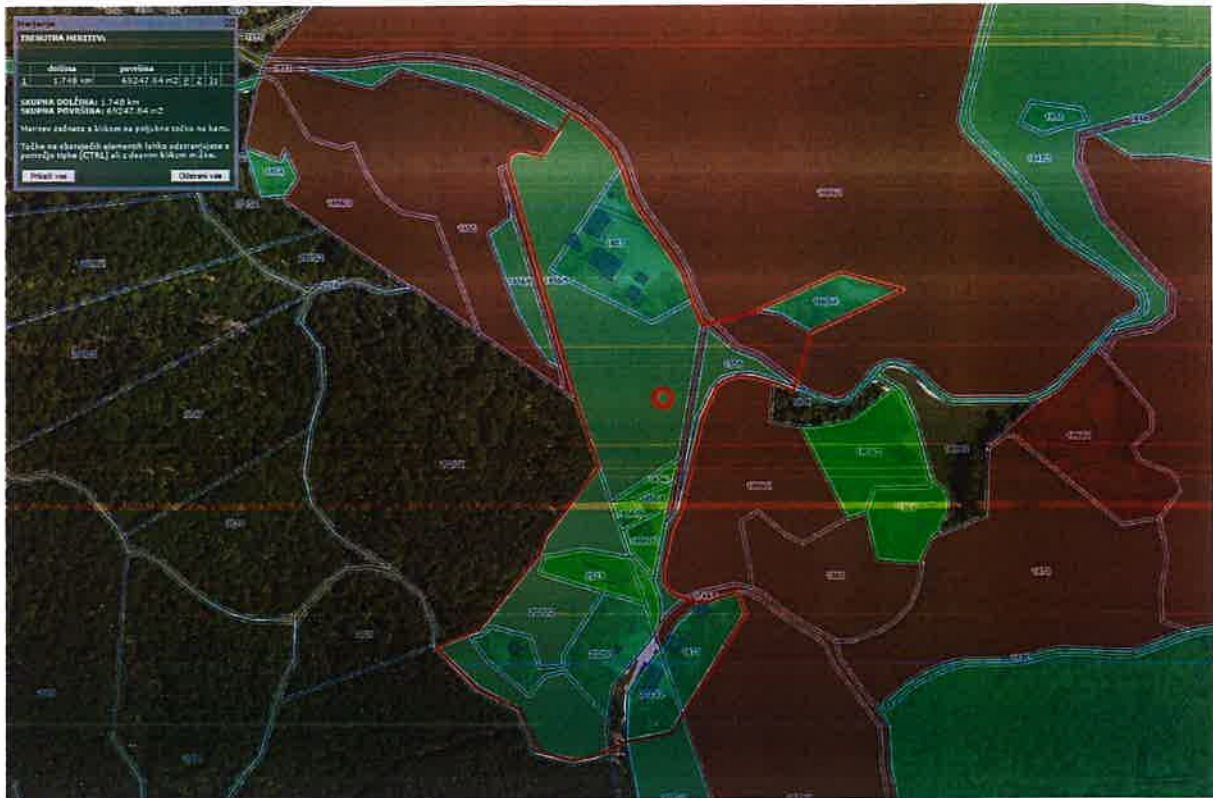
Slika 1.1: Prikaz ožjega območja natečajnega območja